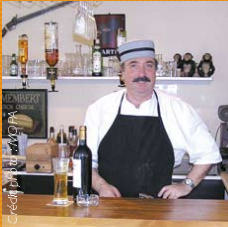
Le Saint-Philippe à Saint-Philippe-d'Aiguilhe (33350)