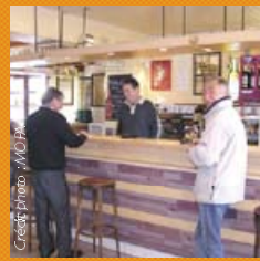
Cercle de l'Union à Pissos (40410)