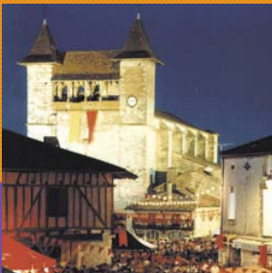
Bastide de Villereal (47210)