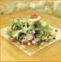
"Ma salade gourmande" La Réserve à Samazan (47250)