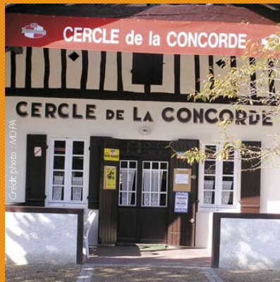
Cercle de la Concorde à Lucmau (33840)