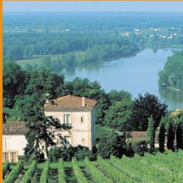
Vignes à Biac (?????)