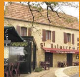
Auberge du Saint-Hilaire à Trémolat (24510)