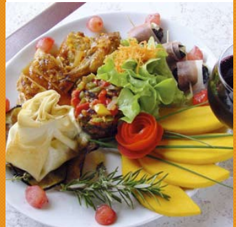
~~~~~ ~~~~~ (???)